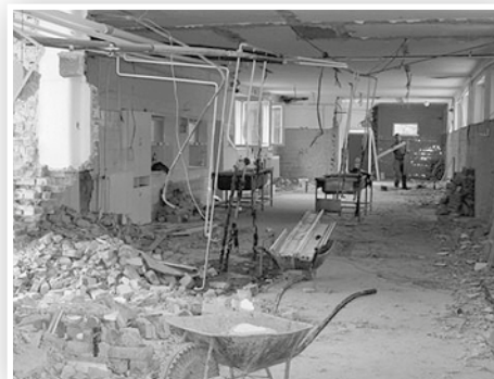
Nagyban zajlanak a munkálatok az oviban

Köszönet az összefogásért! Megkezdődött az óvoda átalakítása, felújítása júl. 1-jén. Előtte a szülői szervezet vezetője és képviselői a szülőket összefogva segítettek az óvoda hátsó részének – logopédia, fejlesztő szoba, konyha, raktárak és egyéb helyiségek bútorzatának és berendezéseinek kiürítésében, kirakodásában. Június 27-én már a reggeli órákban folyamatosan jöttek segíteni, fő-