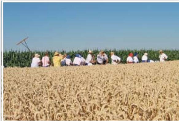
Holnap ismét aratók foglalják el a kijelölt búzátáblát

17-én Zerkovitz Béla Csókos asszony című nagyoperettje lesz látható, augusztus 13-án este Mága Zoltán hegedűvirtuóz és Pitti Katalin együtt lép színpadra, majd augusztus 19-én Koltai Róbert főszereplésével az Én és a kisöcsém című zenés darabot mutatja be