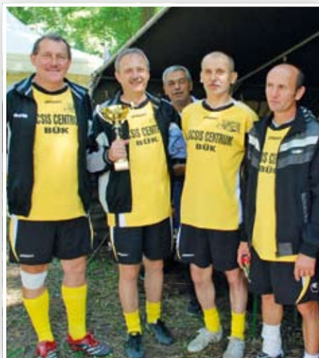
A bükki csapat illő módon búcsúzott a vándorkupától