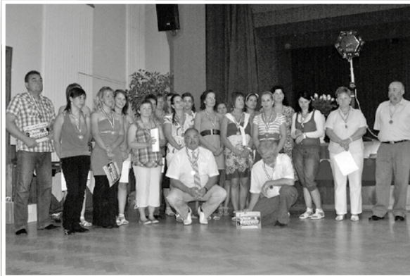
Kézilabdásaink bronzéremmel a nyakukban

az első helyen végeznünk. Nagy öröm számunkra még az is, hogy elindul sok év után a megyei bajnokság, így itt is tudjuk szere-