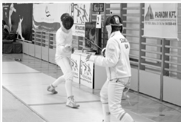
A gyerekek fegyelmet tanulnak a versenyek során

Településünkön rendezte meg a Szombathelyi Vívóakadémia Egyesület és az Olimpici KHA június derekán a versenydíjzáróként a Bükfürdő kupát. Ennek során több száz fiatal vívott egymással a bükki sportcsarnokban.