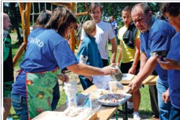
A kültéri kemencében ízletes langalló sült

A rendezvényen arcfestés, kézműves foglalkozások, ingyenes szűrővizsgálatok, és helyi termékek vására várta az érdeklődőket. Délután a damonyai lányok hip-hop bemutatóval rukkoltak elő, majd a bőfi mazsorett és társastáncsoport lépett fel. Szerepeltek a bőfi rockysok és Napsugár táncsoport, a bükki