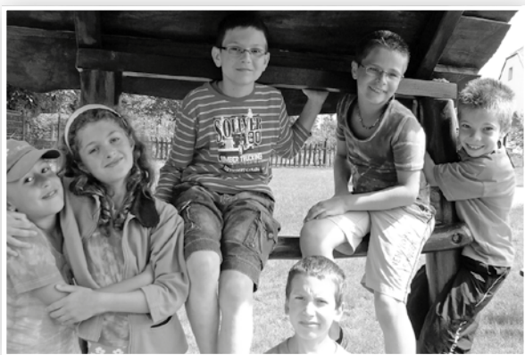
A tanulás mellett a pihenésre is jutott idő