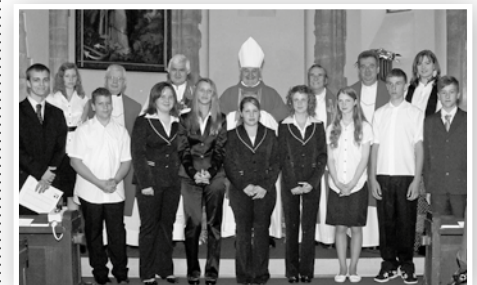
Ezúttal tíz fiatal bérmálkozott