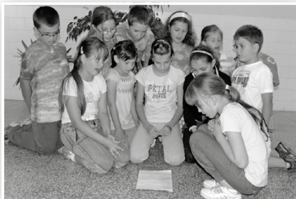
Játékos foglalkozáson a gyerekek

Fegyelmezett, játékos fogékony gyerekekkel töltöttük el a hetet. Akire apró panasz is lett volna, ott a problémát a csapat-