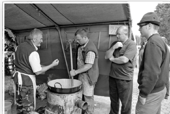
A büki vadászok sem hiányozhattak a főzőversenyről