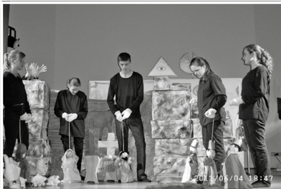
Óriási tapsvihart kaptak Németországban a bükiek

12-kor megkezdtek a színpadépítést, kaptuk a hang- és fénytechnikát, mindent kipróbáltunk, minden a helyén, és jött a közönség! Indult A hegyeket mozgató szívek című előadásunk! Előtte a Büköt, a csoportot és a gyü-