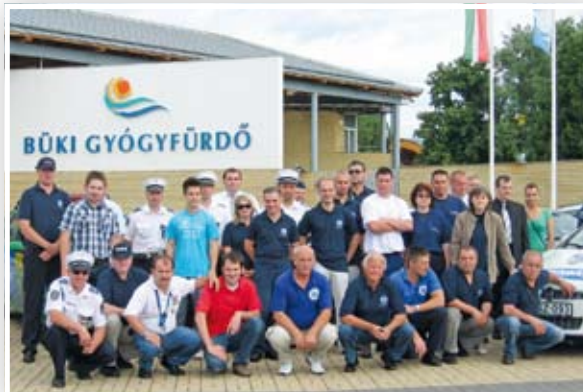
12 egységgel vadászott a NAKE megyénkben