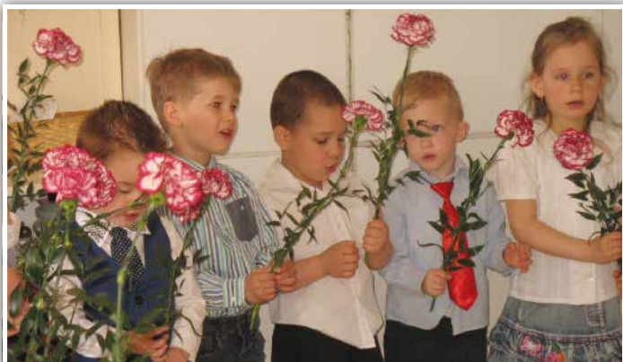
Mazsola csoportosok köszöntője