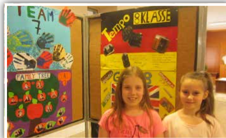
Az osztályok idegen nyelvű bemutatása

„WALPURGISNACHT – BOSZORKÁNY-SZOMBAT” címmel vetélkedőt tartottunk a hatodik évfolyam részére. Először az ünnep eredetéről, történetéről hallottunk ismertetőt német és magyar nyelven. A változatos feladatokban a magyar irodalmi memoriterek és filmsorozatok, rajzfilmek misztikus szereplőinek beazonosítása is a diákok elé került. Hamar kiderült ki mennyi verset tud, illetve mennyit ül a tv előtt. A vetélkedőn mindenki nyertesnek