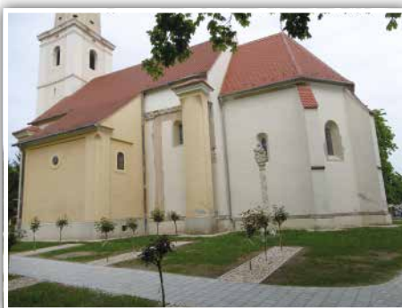
A felújított templom és környéke