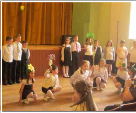
Anyáknapra ünnepi műsor

Az évfolyamok a tanító néni irányításával összeállított, elkészített meglepetése a kedves kis műsorok mellett a saját készítésű, személyes ajándékok voltak az édesanyáknak, nagymamáknak. Minden ajándékműsor más volt, mégis egyről szólt: „Édesanyából csak egy van a világon, és amiből csak egy van, azt vigyázom!” Az első osztályos kislányok színes szalagos tánccal kedveskedtek szerető édesanyjuknak, majd a fiúkkal együtt versekkel, dalokkal köszöntötték őket. A másodikosok