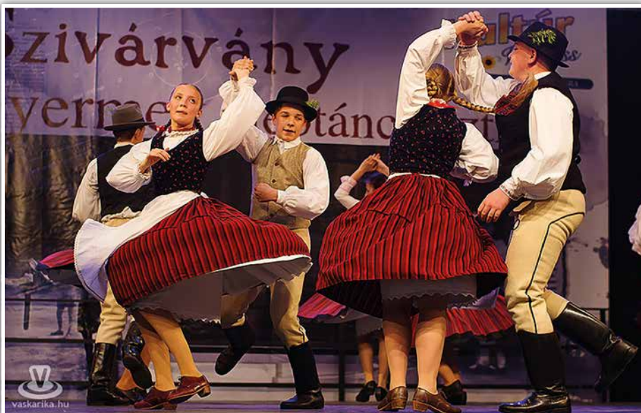
Pörgő szoknyák, táncos lábak

Kellemes, napos idő támogatta a horgászokat a vasárnapi programokat nyitó horgászversenyen, a büki Horgásztónál. A „vizes verseny” után délután már a földön jártak az események: előbb az Ungaresca együttes táncos támogatásával májusfát állítottak a civil szervezetek a Koczán-háznál, majd Atriumban „duplabés” buli vette kezdetét: előbb a Belmondo, majd pedig a Bikini szórakoztatta a közönséget. A májusfa állításon az eddigi évekhez képest is több érdeklődőt vonzott ez szép hagyomány.