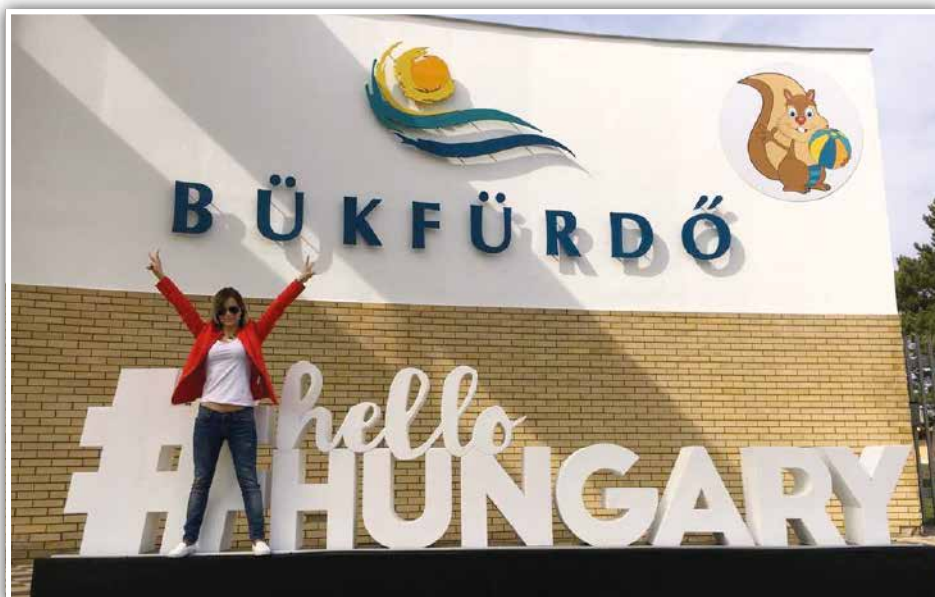
A fürdő nyári bejárata