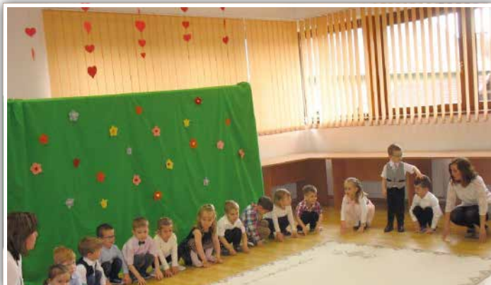
Pillangó csoportosok éneklék – Kicsi vagyok én, majd megnövök én...

Az év legszebb ünnepei közé tartozik Anyák Napja. Mindegyikünk édesanyja nagy-nagy szeretettel vette körül, veszi körül gyermekét, gondozza, ápolja, táplálja. Az édesanya szerető gondoskodása nemcsak gyermekük testi szükségleteire terjed ki, a lelki, szellemi nevelés is nélkülözhetetlen. Ő az, aki önzetlenül áll gyermeke mellett, figyeli minden apró lépését, azt szeretné, hogy öröm és szeretet kísérje életében.