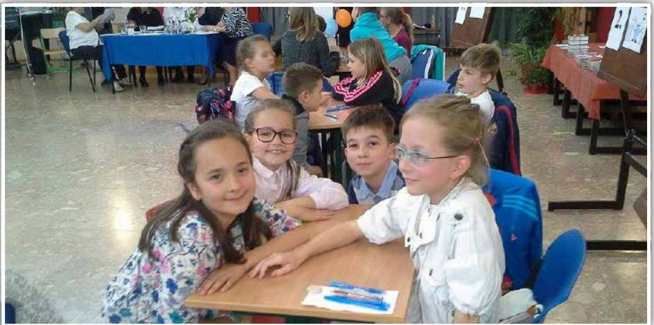
A Picurka szabálykövetők

Ezek az alkalmak a gyerekek játékos felvilágosítása mellett a biztonságos életvitelük elérése volt a cél. Ehhez kapcsolódva a Vas Megyei Rendőr-főkapitányság 18. alkalommal rendezte meg a D.A.D.A. versenyt Szombathelyen. Az idei évben az alsó tagozatosok 3. és 4. osztályosai mérték össze tudásukat. A verseny témájaként az „Egyedül otthon, biztonságban otthon” című témakört jelölték meg. Az életkori sajátosságoknak megfelelő szintű felkészítés során a gyerekek hasznos ismereteket szereztek arról, hogyan kell viselkedni, ha egyedül vannak otthon. Különbséget kell tenni, ki az idegen és az ismerős, hogyan kell velük szemben viselkedni. Például: Nem fogadok el idegentől semmit, nem mondom el idegennem a személyes adataimat, nem szállok be idegen autóba. Nagyon fontos témakör ez, különösen a büki gyerekek számára, hisz turisztikai városban élünk, sok az idegen, főleg a nyári időszakban. Közeleg a nyári szünet, egyre több gyerek lesz egyedül otthon, ha csak 5-10 percet is, amíg anya vagy apa elszalad a postára vagy a boltba, ez alatt az idő alatt is kerülhetnek váratlan helyzetbe a gyerekek. Megtanulták azt is, hogy milyen veszélyek leselkedhetnek otthon rájuk – vegyszerek, háztartási kisgépek, elektromos áram, gyógyszerek, szerszá-