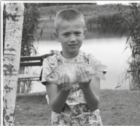
Ezt én fogtam...

Milyen eredménnyel horgásznak a gyerekek?