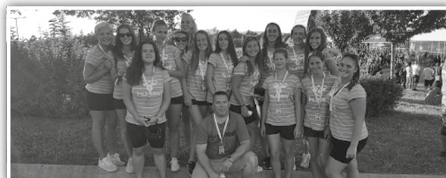
Büki junior csapat