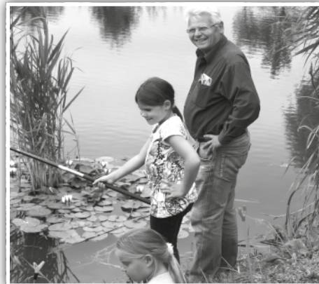
A lányok is horgásznak

Kétezer forint hozzájárulást kértünk, de kapnak a gyerekek süteményt is, gyümölcsöt is, és készül már nekik a szalonnás langalló is. Holnap délután szalonnát sütünk, egyúttal a szülők előtt kihirdetjük a halfogó verseny eredményét is.