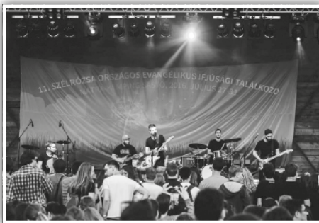
A zene is központban volt

A közös napindítás után egyházunkat, világunkat érintő problémákról, megoldásra váró kérdésekről hallhattunk előadásokat, folytathattunk beszélgetéseket. Ökumenikus kapcsolatainkat erősítve, számos más fele-