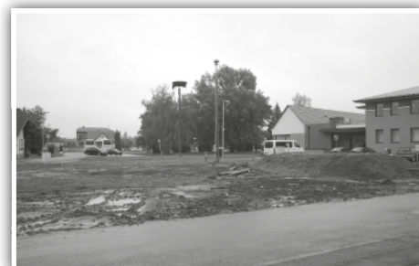
Új tér alakul a hivatal mögött