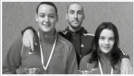
A győztes lányok edzőjükkel