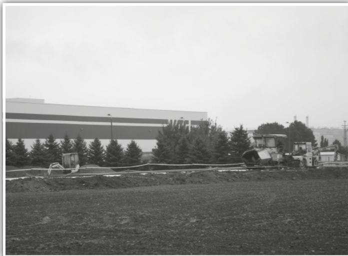
Épül az elkerülő út