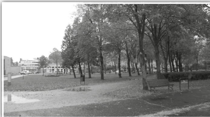
Itt lehet az új központ