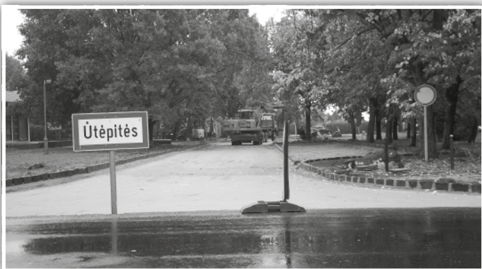
Épül a buszforduló