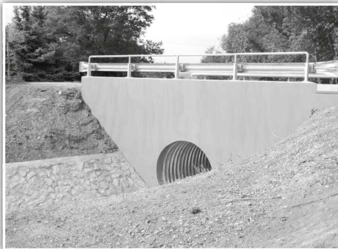
A Fekete úti új híd