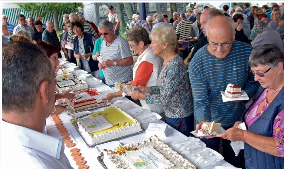
Méltó módon ünnepelte 15. születésnapját a Termál Kemping – a vendégek számos édes különlegességéből választhattak