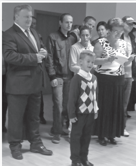
Ünnepi gondolatokkal köszöntötték az elsősöket

nerei legyenek az iskola pedagógusainak, mint ahogy azt az óvodában tették, és biztosította őket az iskola részéről is a viszonzásban. Az intézmény vezetője köszöntő szavait követően kézfogással fogadta a kis elsősöket az iskola tagjaivá.