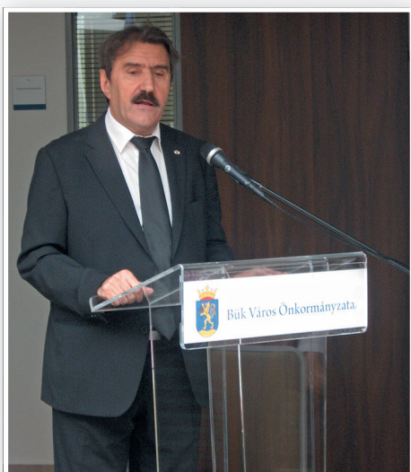
Eperjes Károly Szent Istvánt idézte: „Ha Isten velünk, ki ellenünk?”

Eperjes Károly beszédében szólt Széchenyi Istvánról is, akit a legnagyobb magyar-ként ismerünk. Pedig Széchenyi tudta, hogy Szent István volt, van és lesz a legnagyobb magyar – fogalmazott a szónok, aki beszéde zárásaként Babits Mihály Eucharistia című versét szavalta el.