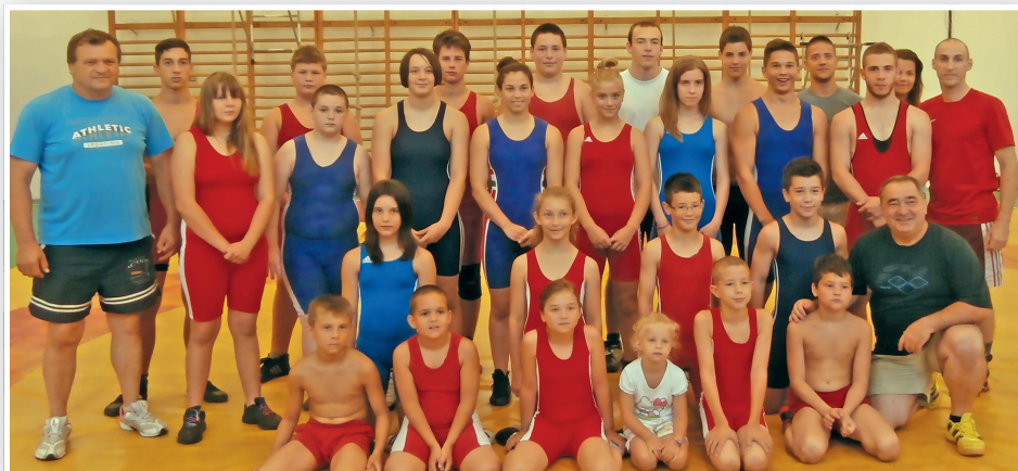
Kiskunfélegyházi és bükki birkózók közös edzőtáborban készültek