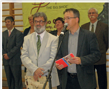
A jubileumhoz könyvbemutató is társult