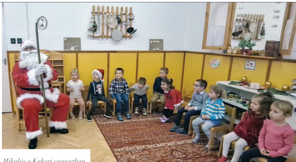
Mikulás a Kukori csoportban

December 6-a egy bábszínházzal kezdődött, melyből a gyermekek megtudhatták, hogy az erdő állatai hogyan várták a jóságos Mikulást. Az előadás