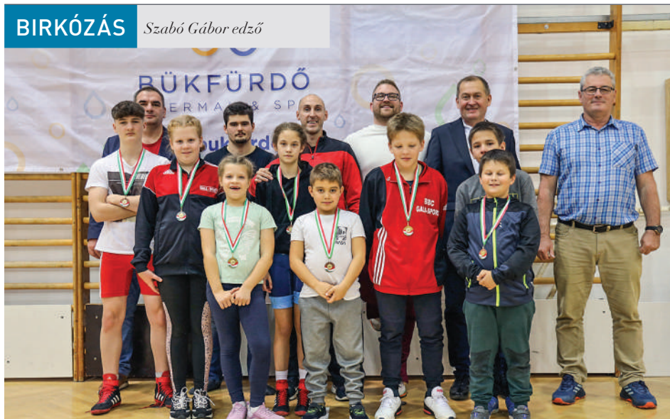
A bükiek a X. Bükfürdő-Castrum Sec kupa Nemzetközi Szabadjfogású Birkózó gálán

Tizenöt csapat százhuszonöt versenyzője mérte össze erejét a birkózó-szőnyegeinken november 25-én.