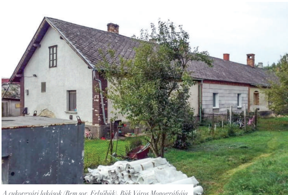
A cukorgyári lakások (Bem sor, Felsőbük), Bük Város Monográfiája

Folytatás a Büki Újság következő lapszámában.