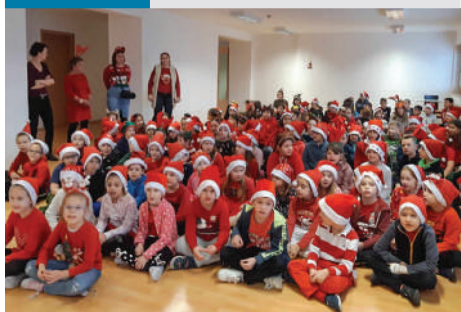
Izgatott „manók” várták a Mikulást

A gyerekek nagy öröme a Mikulás ünnepe meghozta az oly gyakran megénekel „pelyhes fehér havat”, így még hangulatosabbra sikeredett a Mikulás-várás az iskolában.