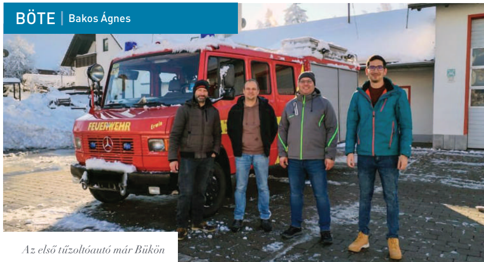
Az első tűzoltóautó már Bükön

Már online is aktív a Büki Önkéntes Tűzoltó Egyesület: ausztriai és németországi partnerségről számoltak be.