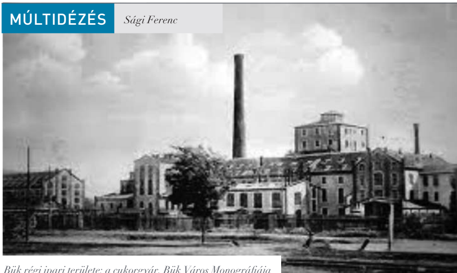
Bük régi ipari területe: a cukorgyár, Bük Város Monográfiája

A Petőházi Cukorgyár tulajdonát kezében tartó közkereseti társaság 1912-ben részvénytársasággá alakult át. A részvényei túlnyomó többségét (73,3%-át) már ekkor a bécsi Schoeller bankház cukoripari érdekeltsége szerezte meg. Az 1920-as évek végén és az 1930-as évek elején a Schoeller család és a Petőházi Cukorgyár Rt. tulajdonába került a Nagycenki Cukorgyárak Rt. részvényeinek többsége. A Hartig és Rothermann család részvényei zömének megvásárlása után, 1929-től az igazgatóság üléseinek egy részét már Bécsben, a Schoeller & Co. üléstermében tartották. A Patzenhofer család részvényeinek 1931. áprilisi kivásárlását követően az igazgatóság ülései megritkultak. Az 1930/1931. évi kampány után, a „nyersanyag-ellátási problémák miatt” az évek óta veszteséges Nagycenki Cukorgyár termelését leállították. A még meglevő gazdaságok zömének irányítása már ekkortól Petőházáról történt. A gazdaságok répatermése nagyobb részét Petőházán, kisebb részét Ácson dolgozták fel. A Petőházi Cukorgyár Rt. 1932. évi közgyűlésének elnöki beszámolója szerint a gazdasági világválság hatására kialakult helyzet „enyhítésére csak egy kivezető út volt: üzemünk egyesítése a Nagycenki Cukorgyárak Rt-ával... A tisztviselői és munkáskarnak így lehetségessé vált leépítése a legkíméletesebb módon