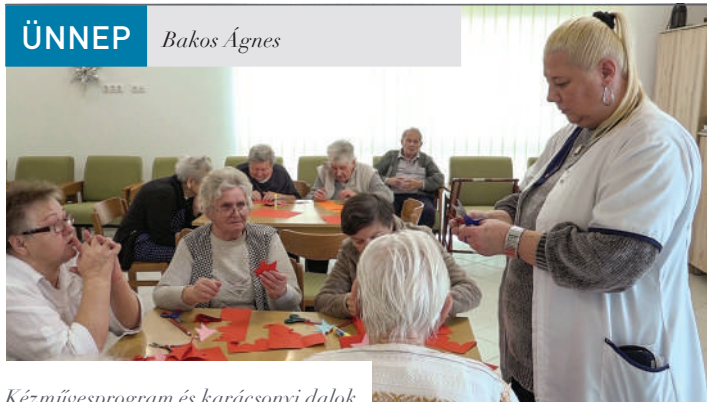
Kézművesprogram és karácsonyi dalok