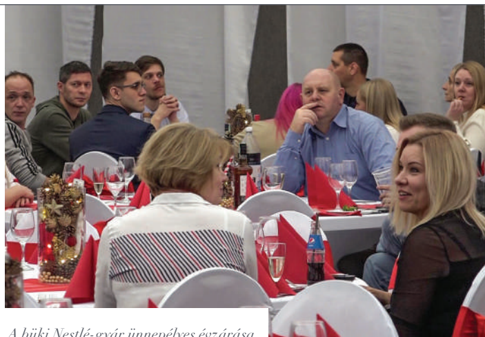
A büki Nestlé-gyár ünnepélyes évzárása

Évet zárt a büki Nestlé gyár több mint 800 dolgozója. Olyan sokan, hogy két részletben tartottak év végi, karácsonyi vacsorát. A helyszín az ünnepi díszbe öltöztetett büki művelődési központ volt.