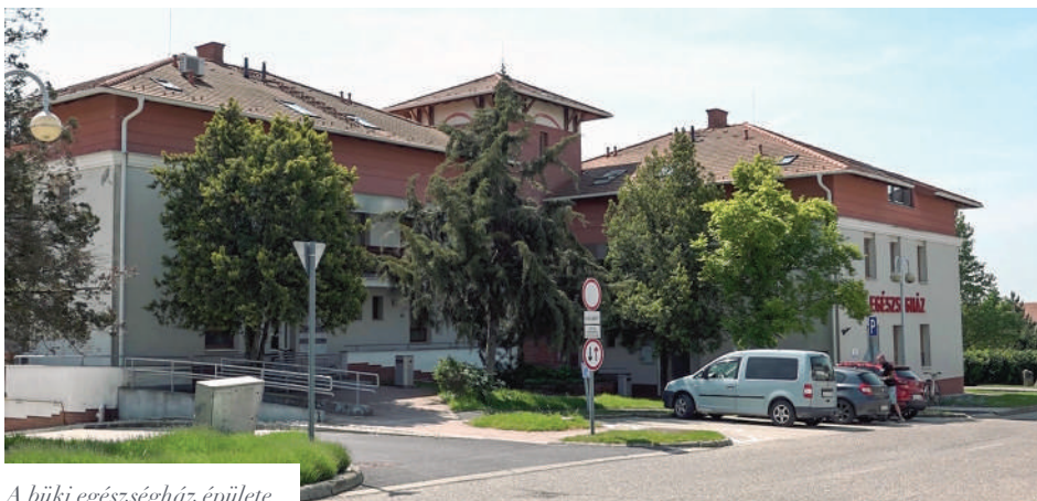
A büki egészségház épülete