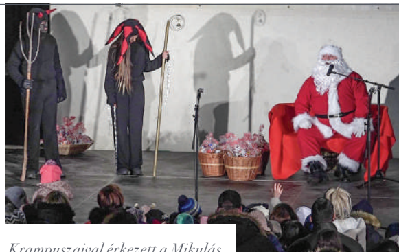
Krampuszaival érkezett a Mikulás

Elkészítették a Mikulás sütijét a Felsőbüki Nagy Pál Általános Iskola diákjai, miközben kicsik és szüleik várták a nagy szakállút az Atriumban. A hideg ellen is szóltak a Mikulás-váró dalok és az erdei mézes sütemény receptje.