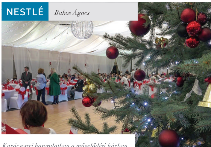
Karácsonyi hangulatban a művelődési házban