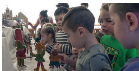
Közelről is szemügyre vették a gyerekek az édes kiállítást

Napról napra egyre több mézeskalács érkezett, és hét végére szinte nem volt olyan ág a fenyőfán, amin ne lett volna mézeskalács. Ráadásul az óvodások a csoportokban is szorgalmasan sütöttek, így az egész óvodát napokig mézeskalács illat járta át, ami óvodán téli díszítését kiegészítve igazi karácsonyi hangulatot teremtett.