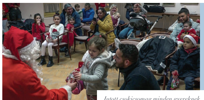
Jutott csokisomag minden gyereknek

A közmeghallgatás után érkezett a roma önkormányzat szervezésében a Mikulás: az alkalomra a legkisebbek is Mikulás-ruhával és verssel, énekkel készültek.