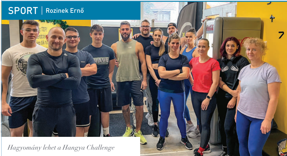
Hagyomány lehet a Hangya Challenge

Idén decemberben először rendeztük meg a Maxx GYM házi bajnokságát, a Hangya Challenge-et. A 16 versenyző 5 számban mérte össze tudását és erejét: fekvő nyomás/fekvőtámasz, húzódzkodás, guggolás, vállból nyomás és evezés.