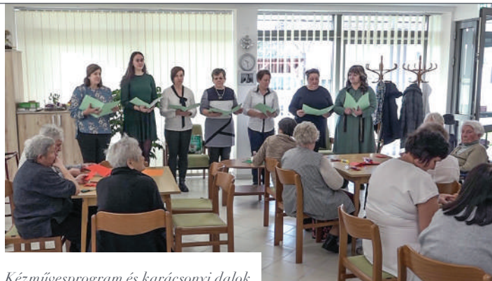
Kézművesprogram és karácsonyi dalok

Vendégek fogadására is alkalom volt az advent a Dr. Horváth Tibor Szociális Központban: az óvoda pedagógusainak kórusa adott műsort és a városból érkezett résztvevőkkel zajlott kézművesprogram.