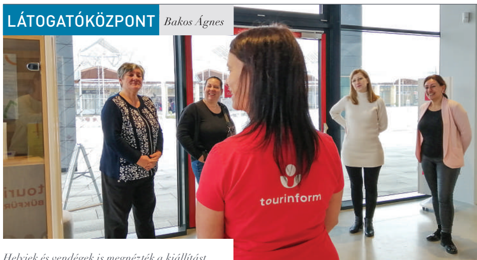
Helyiek és vendégek is megnézték a kiállítást

A gyógyvíz kialakulásától az árokfürdőzésen át a mai fürdőszolgáltatásokig vezet a tárlat a Termál tér Látogatóközpontjában – ezt is bemutatja az adventi séták sorozat a Tourinform Bükfürdő szervezésében.