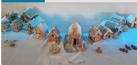
Átthatja a karácsonyi hangulat az iskolát

A Felsőbüki Nagy Pál Általános Iskola életében a december egy nagyon mozgalmassá, de meghitt, várakozással teli időszak. Az ünnepekre való készülődés áthatja a mindennapokat.