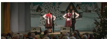
December 15-én a 70 éven felüli bükieket látták vendégül