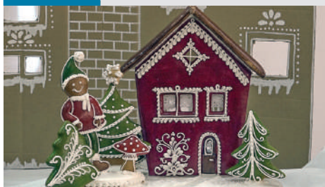
Ünnepi hangulatot hoztak a mézeskalácsok Csodaországba