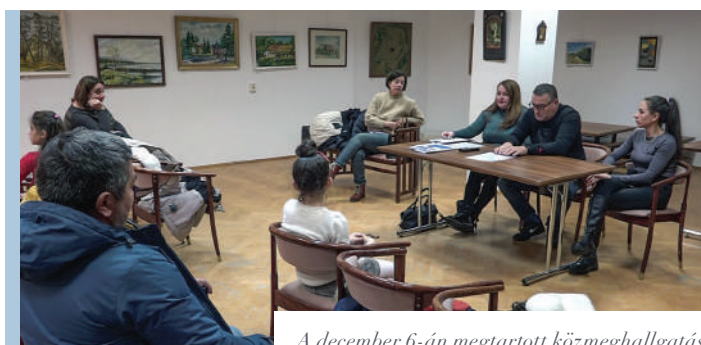
A december 6-án megtartott közmeghallgatás