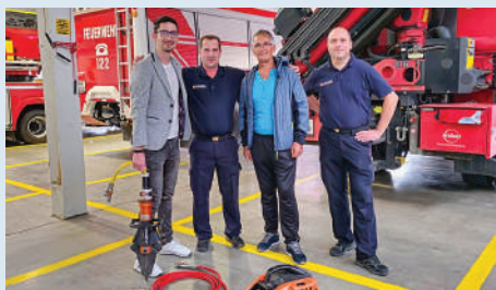
A BÖTE partnere a Feuerwehr Oberpullendorf

Aztán a tél első napjaiban Németországban jártak a büki egyesület képviselői: Holzgünz településről hozták az első tűzoltóautójukat. A gépjárműfecskenő a büki önkormányzat támogatásával sikerült megvásárolni. Az autó kifogástalan állapotban van, saját kerekein, minden gond nélkül tette meg az új otthonáig a több mint 600 kilométert.