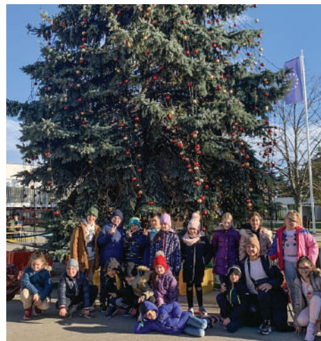
Mozgalmas Erzsébet-karácsony Zánkán

Csodálatos díszítésű, karácsonyi fényárban úszó tér fogadott minket. Mind a kulturális, mind a sport, szórakoztató, szabadidős és adventi programok nagyon színvonalasak voltak. Az első nagy program a sportvetélkedő volt, ahol érdekes, játékos karácsonyi feladatokkal mérhették össze erejüket a csapatok. A nap végét karácsonyi táncbázzal zártuk.