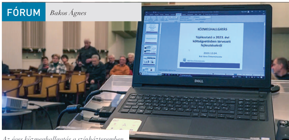
Az éves közmeghallgatás a színházteremben

Pályázati sikerek, beruházások, tervek és gazdasági eredmények összességével mellett számos kérdés és az azokra adott válasz is része volt a büki közmeghallgatásnak.