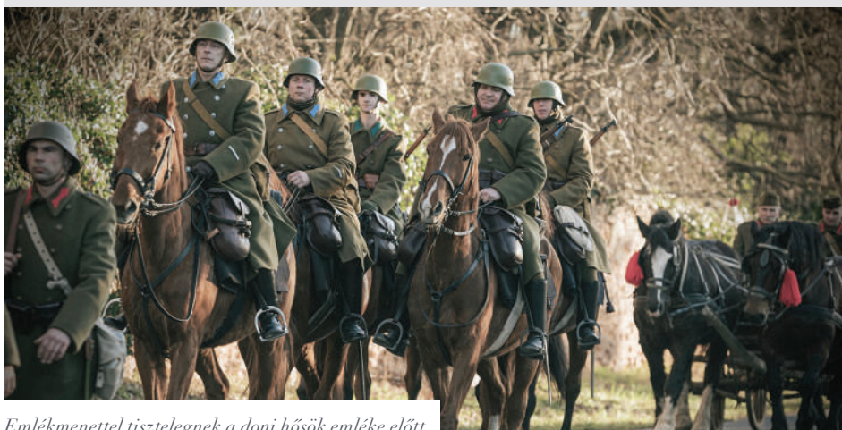
Emlékmennel tisztelegnek a doni hősök emléke előtt

1942-43 telén a Don folyó partján helytállt magyar katonák hősiessége előtt. A mintegy 33 kilométeres gyalogmenet végállomása Bük lesz ezen a napon, a menetet a kör tagjai korabeli ruházatban és fegyverzetben teljesítik. Aki szeretné megtekinteni a korabeli katonai menetet, az 15 óra körül, a csapat Bükre érkezésekor megteheti. A megemlékezést követően a korabeli felszerelések testközelből is láthatóak. Szeretettel várják a megemlékezőket! Másnap a 10 órás szentmisén tisztelegnek a hősök előtt a Szent Kelemen-templomban.